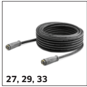
27, 29, 33